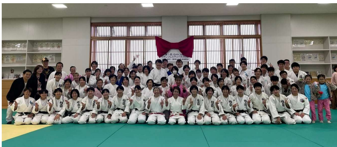
役員・実行委員記念撮影